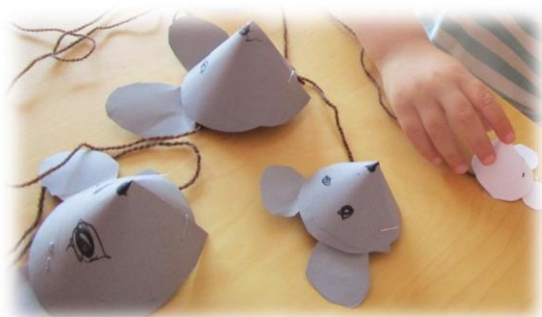
Eine schöne Idee

Aus den anderen einzelnen Fotos wurde ein Familienmemory. Auf der einen Karte waren die Eltern des Kindes und auf der anderen Karte das Kind. Und dann konnte das Spiel beginnen! Für die Kleinen Füße war das eines der neuen Lieblingsspiele.